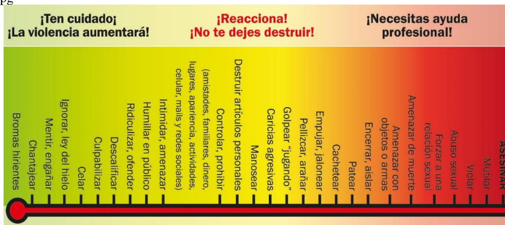
Figura 1. Violentómetro. Instituto Politécnico Nacional, https://www.ipn.mx/assets/files/genero/img/mat-apoyo/b-violentometro.jpg

La Unidad Politécnica de Gestión con Perspectiva de Género (UPGPG, 2015) diseñó un material gráfico y didáctico, cuya imagen semeja una regla de medir y que permite identificar diferentes conductas de violencia de género, que al presentarse cotidianamente suelen pasar desapercibidas o ignoradas o confundidas con un supuesto comportamiento normal (Figura 1). La escala del llamado Violentómetro que se encuentra registrado ante el Instituto Nacional del Derecho de Autor con los Certificados de Registro Número 03-2009-120211370900-01 y 03-2013-090510414900-01 , está dividido en tres escalas o niveles de violencia, y de acuerdo con sus creadores, las manifestaciones de violencia que se muestran en el material no son necesariamente consecutivas.